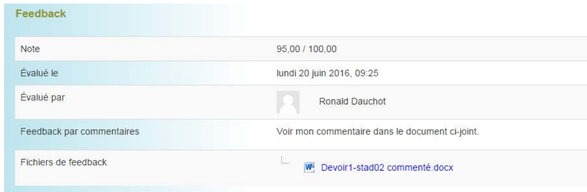
Figure 9 : Exemple d'un devoir où le professeur ou la professeure a déposé une nouvelle version du devoir rendu de l'étudiant ou de l'étudiante avec ses commentaires à l'intérieur.