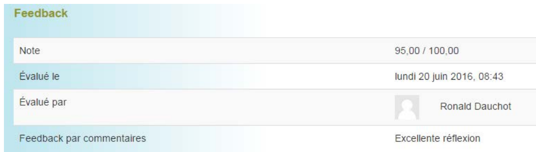
Figure 8 : Page d'un devoir avec la section Feedback