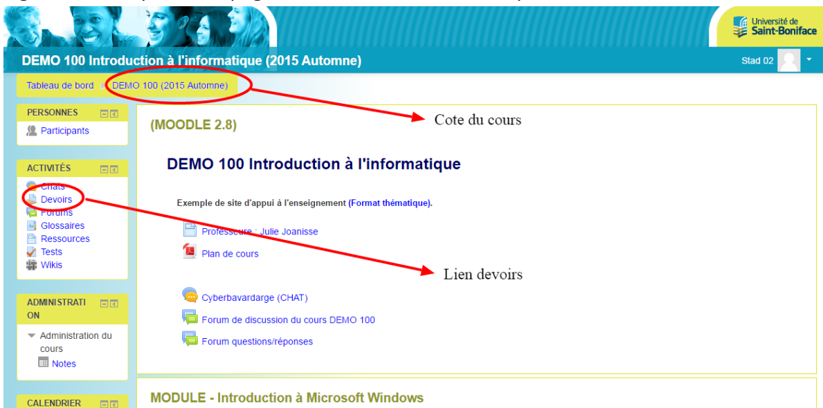
Figure 3 : Exemple d'une page d'accueil d'un cours sur la plateforme eCAMPUS